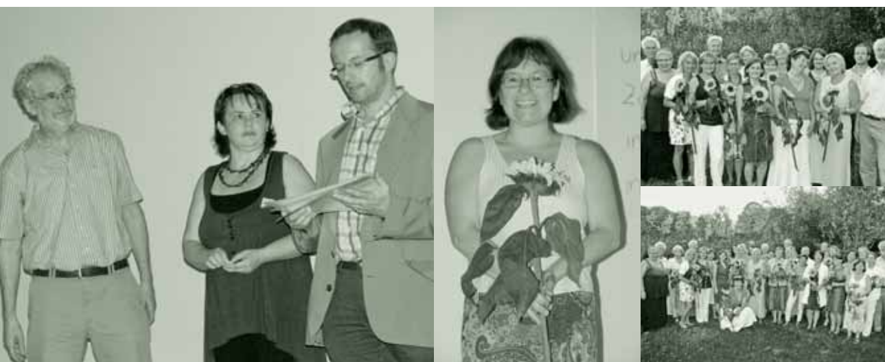
AbsolventInnen des Lehrgangs 25 für „Lebens-, Sterbe- und Trauerbegleitung“ nehmen beim Sommerfest ihre Zertifikate entgegen.